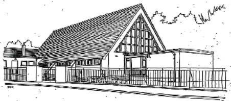
Drawing by John R Hume, courtesy of Scotland's Churches Trust