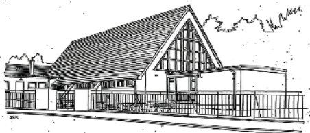
Drawing by John R Hume, courtesy of Scotland's Churches Trust